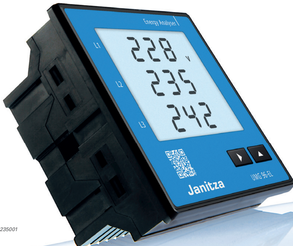
UMG 96-EL Artikel-Nr.: 5235001

Weitere Informationen: www.janitza.de/96-el